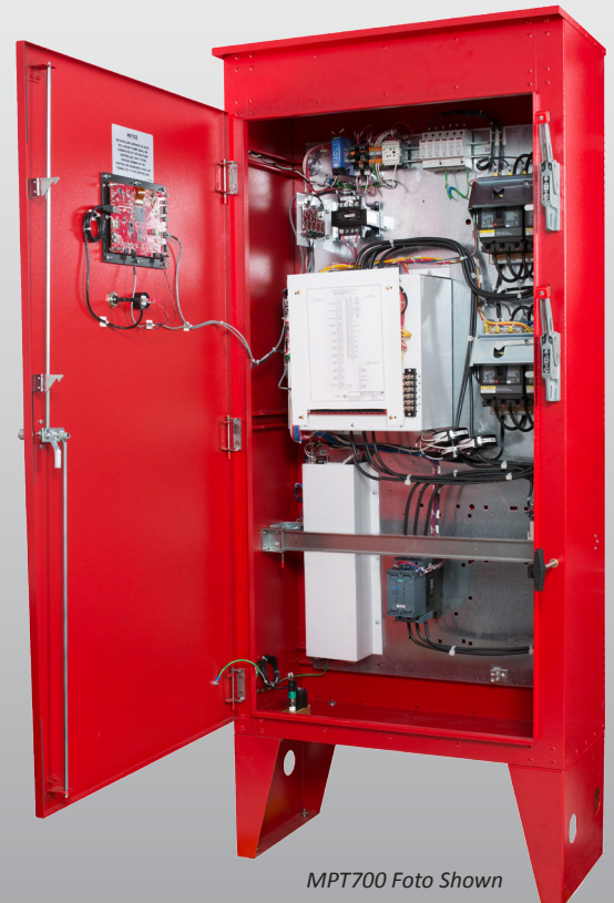
MPT700 Foto Shown