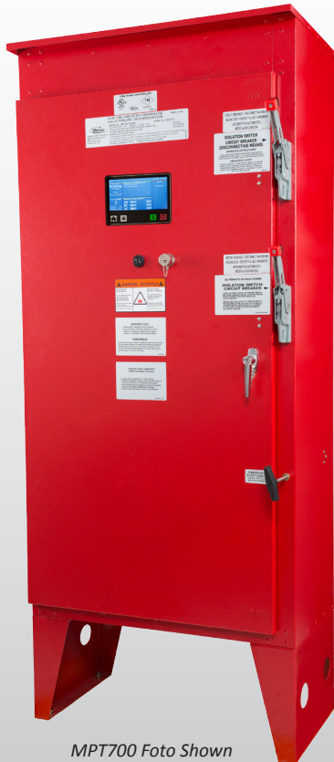
MPT700 Foto Shown

Disponibles en los métodos de arranque Arranque directo, Arranque suave, Triángulo de transición abierta y Transición cerrada