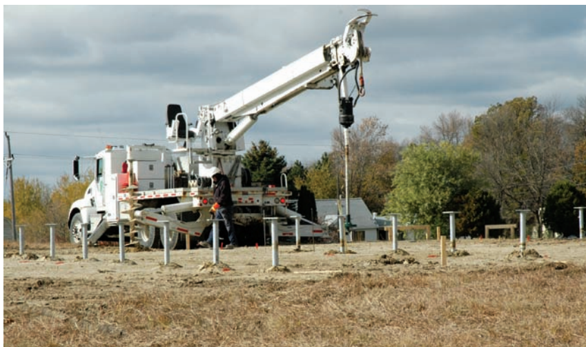
Utilización de equipos estándares