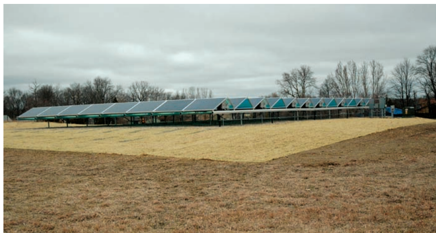
Listo para generar

Todas las imágenes tomadas en la región del lago Electric Co-op durante la primera instalación. Toda la instalación se llevó a cabo por los empleados de la cooperativa.