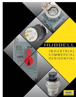
Catalogue de la gamme complète