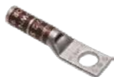
Borne de classe B/C (YA2CN illustré)

*Épaisseurs: Nombre de sertissages requis pour chaque côté